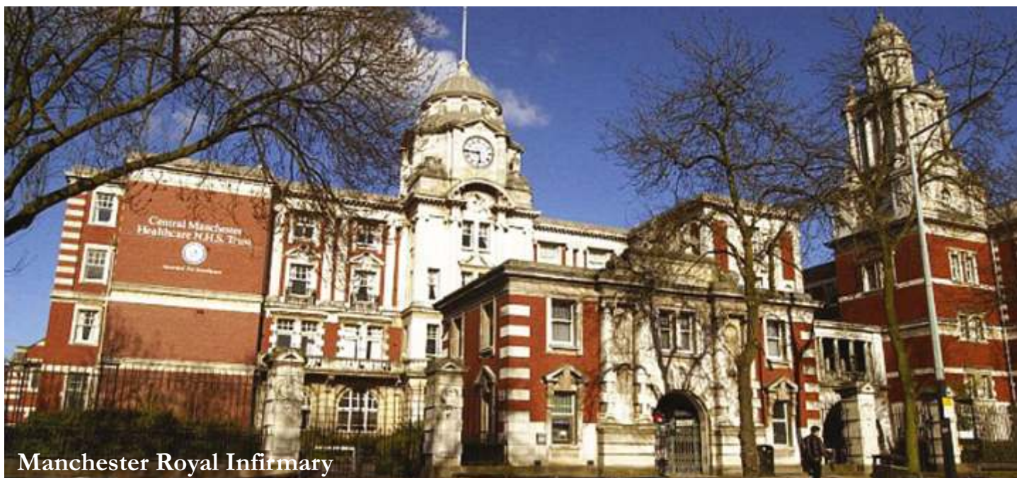
Manchester Royal Infirmary

Printre numeroasele premii și distincții, se numără și decernarea, în anul 2004, a titlului de Doctor Honoris Causa a Universității de Medicină și Farmacie Iuliu Hațieganu din Cluj.